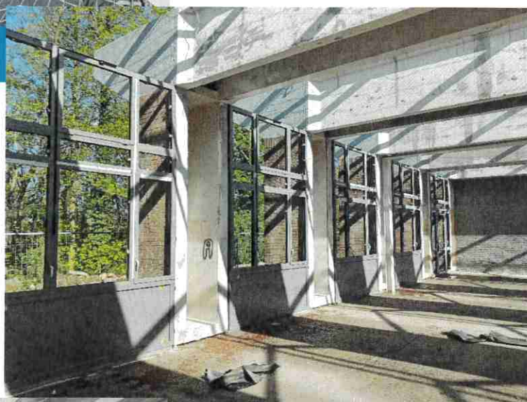
Travaux de pose des ensembles menuisés alu