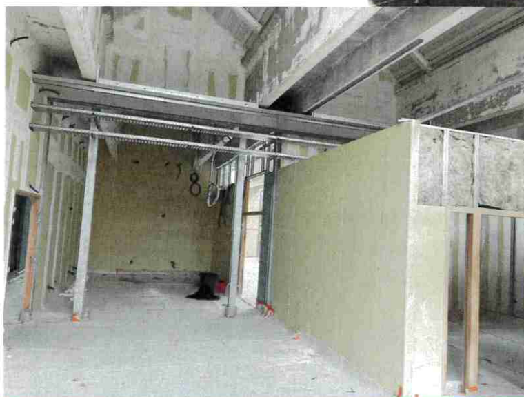
Vue d'ensemble des travaux de second œuvre