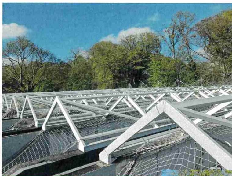
Travaux de pose de la charpente