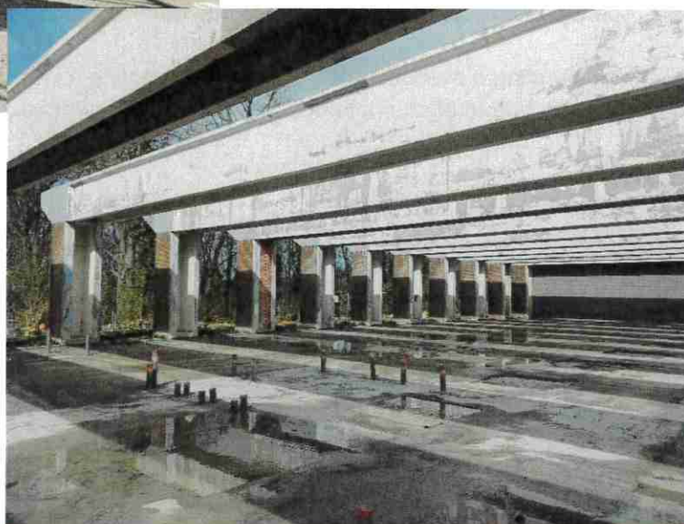
Travaux de réseaux sous dalle et poteaux « vérins » du gros-œuvre – Bâtiment des anciens ateliers